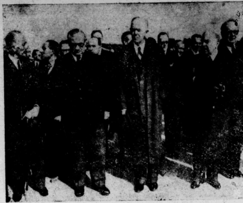
Wakil2 negara besar di UNO, tampak berkumpul memperingati djasas almarhum Bernadotte.

Dr. Bunche, pengganti almarhum Bernadotte, sedang menghirup rokok untuk mengambal piknik bagaimana mendamaikan Arab - Jahudi.