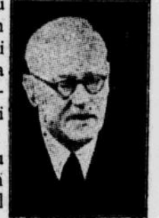
Vishinsky Djago Rus da lam UNO.

Lebih djauh U.P. mewartakan dari Paris bahwa tiap usul dari golongan terbanjak di Dewan Ke amanan tampaknja akan tidak da pat mengatasi veto Rus. Sungguh pun ia hari ini bersikap diam seba gai jg diperintahkan Moscow kepada jandjalanan debat tentang Berlin, akan tetapi wakil Sov jet Andrei Vi shinsky didu ga akan kem bali memaki siasah veto ka lau nanti De wan sampai ketaraf meng ambil putu san untuk men tjampuri soal Berlin.